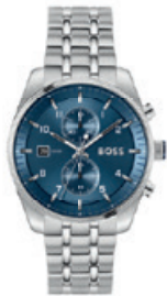
SKYTRAVELLER 1514216 € 349,-

Mit dem neuen Skytraveller setzt BOSS die Tradition seiner ikonischen Pilotenuhr fort. Dieser sportliche und anspruchsvolle Chronograph mit Datumsfunktion beeindruckt durch eine Vielzahl aufregender Designdetails und verleiht jedem Look stilvolle Raffinesse.