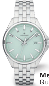
Meister S Quarz 35