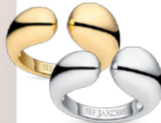
GOCCIA PIANURA RING von € 139