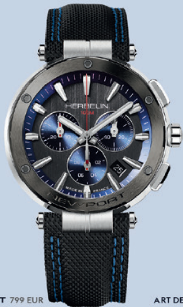
NEWPORT 799 EUR