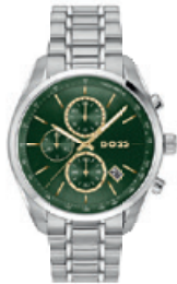
GRAND PRIX 1514266 € 379,-