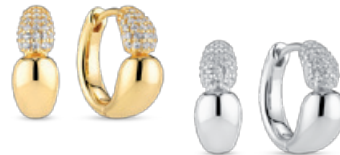
GOCCIA CREOLO PICCOLO OHRRINGE von € 119