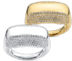
BORSA RING von € 169