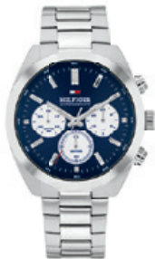
HUDSON 1710722 € 179,-

Halbglänzendes Zifferblatt mit diamantgeschliffenem Totalisator & japanischem Chronographenwerk.