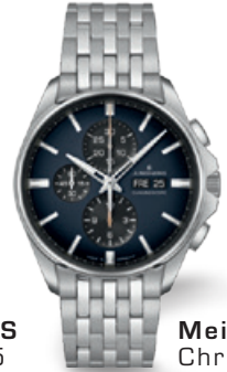
Meister S Chronoscope