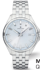
Meister S Quarz 35