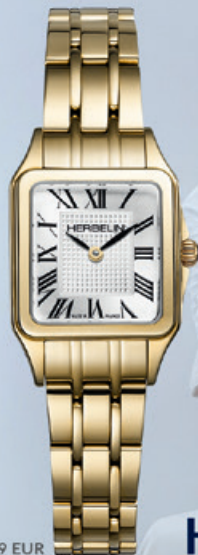
LUNA 549 EUR