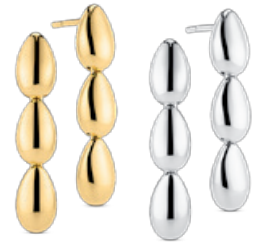
GOCCIA TRE PIANURA OHRRINGE von € 139