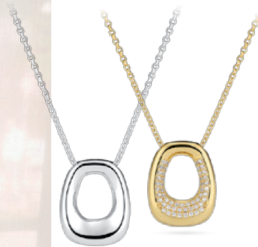
BORSA HALSKETTE von € 149