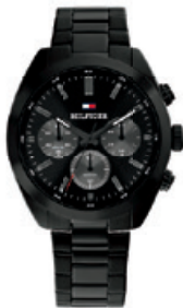
HUDSON 1710724 € 199,-