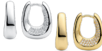
BORSA PICCOLO OHRRINGE von € 139