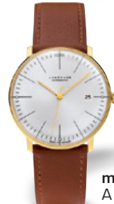
max bill Automatic

Meister S Quarz 35: Quarzwerk, Gehäuse Edelstahl Ø 35 mm, Saphirglas, Edelstahlband, wasserdicht bis 10 bar, UVP 1.090 €