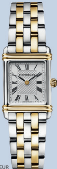
ART DECO 549 EUR