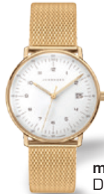
max bill Damen